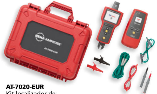
AT-7020-EUR Kit localizador de cables avanzado