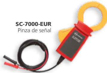
SC-7000-EUR Pinza de señal

Con tres modos de funcionamiento ("alta", "baja" y "pinza") y dos frecuencias de salida (6 kHz y 33 kHz), el modelo AT-7000-TE incorpora las mejores tecnologías disponibles para el rastreo de cables y la identificación de interruptores tanto en circuitos bajo tensión como sin tensión. El AT-7000-TE establece automáticamente la frecuencia en función de la tensión detectada, además de indicar al usuario que adapte el nivel de potencia en función de la aplicación. La pantalla TFT LCD a color muestra los valores de tensión y frecuencia detectados, así como el modo de funcionamiento definido.