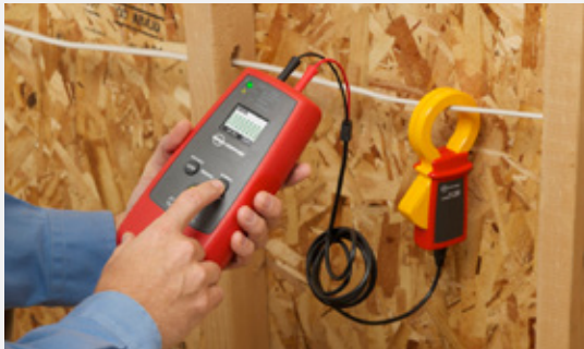
Induzca la señal con la pinza si no hay ningún conductor desnudo.

Rastree cables con y sin tensión en conductos metálicos retirando la cubierta de la caja de conexiones y utilice el sensor de punta del receptor AT-7000-RE para identificar el cable con la señal generada por el transmisor AT-7000-TE. Los cables en conductos no metálicos se pueden rastrear directamente sin necesidad de abrir la caja de conexiones utilizando la tecnología Smart Sensor™ del receptor AT-7000-RE.