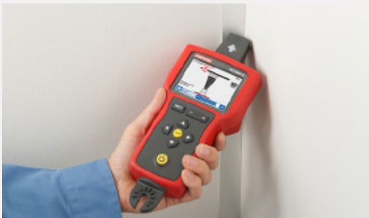
Use el sensor de punta para rastrear cables en zonas de difícil acceso.

El accesorio de pinza para señales SC-7000-EUR se puede utilizar con el transmisor AT-7000-TE para inducir una señal en cables con y sin tensión cuando no se tiene acceso a conductores desnudos. Sólo tiene que ajustar la pinza al cable para inducir una señal y comenzar el rastreo.