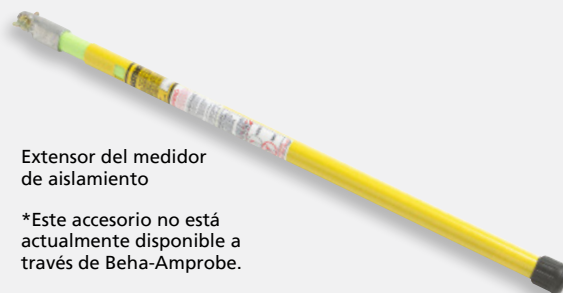
Extensor del medidor de aislamiento

Puede utilizar el extensor del medidor de aislamiento con el receptor AT-7000-RE para localizar y trazar fácilmente cables en techos altos, paredes y suelos. El extensor se puede adquirir en distribuidores de productos eléctricos.*