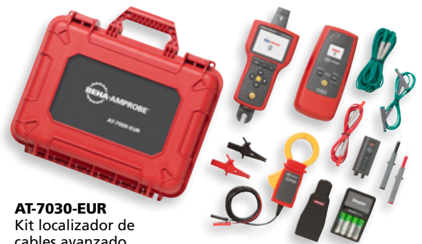
AT-7030-EUR Kit localizador de cables avanzado