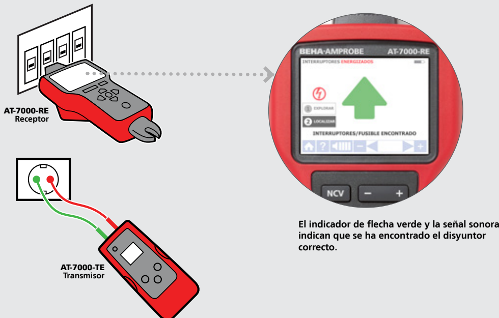
El indicador de flecha verde y la señal sonora indican que se ha encontrado el disyuntor correcto.

En combinación con nuestro potente transmisor que utiliza frecuencias optimizadas para el rastreo de cables con y sin tensión, la nueva función de exploración y localización (Scan and Locate) identifica el disyuntor o fusible correcto con la señal más alta registrada. De esta forma se elimina la confusión procedente de varias lecturas positivas falsas, común en herramientas de rastreo con tecnologías obsoletas.