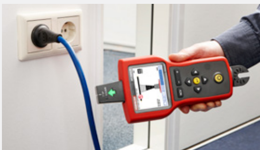
Detección de tensión sin contacto (NCV).

En combinación con el transmisor AT-7000-TE, el sensor de punta identifica la ubicación de cables con tensión y sin tensión en espacios confinados y zonas de difícil acceso. Rastrea de forma simple y precisa los cables con y sin tensión en cajas de conexiones, esquinas, paredes, suelos y techos, hasta una profundidad máxima de 6,1 metros (20 pies).