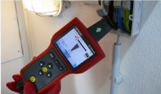
Rastree cables con o sin tensión retirando la cubierta de la caja de conexiones.