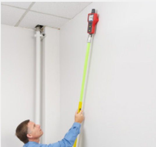
Localice cables en zonas de difícil acceso con el extensor del medidor de aislamiento.

La función NCV amplía las características de funcionamiento del receptor AT-7000-RE al detectar cables con tensión entre 90 y 600 V y entre 40 y 400 Hz sin necesidad de utilizar el transmisor AT-7000-TE. La sensibilidad se puede ajustar para diferentes aplicaciones, desde la detección de la presencia de tensión (más sensibilidad) a la identificación precisa de un cable caliente en un grupo (menor sensibilidad).